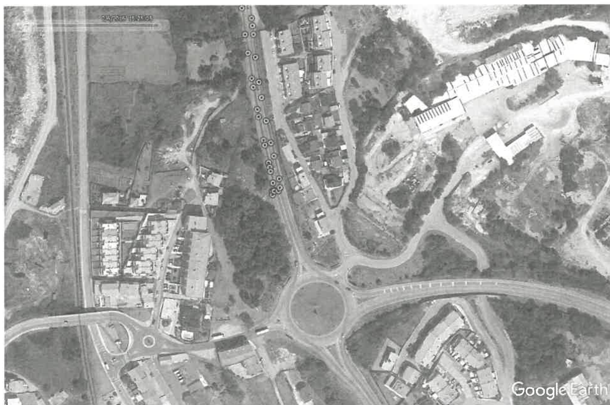
Ponto de Retorno a Sul – Antes da rotunda de acesso à autoestrada A28, V.P. de Âncora