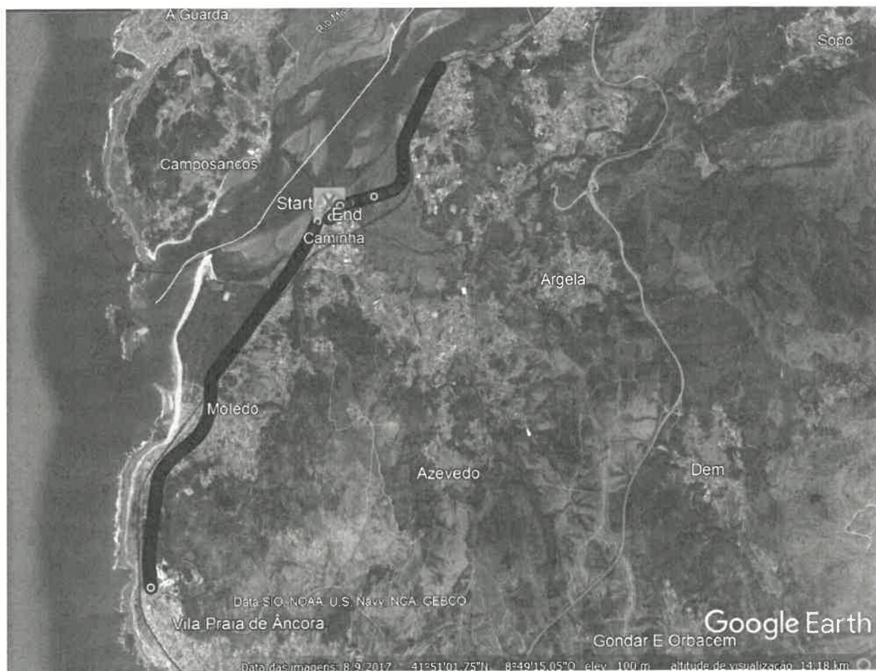
Percurso completo – Entre as freguesias de Seixas e V.P. de Âncora