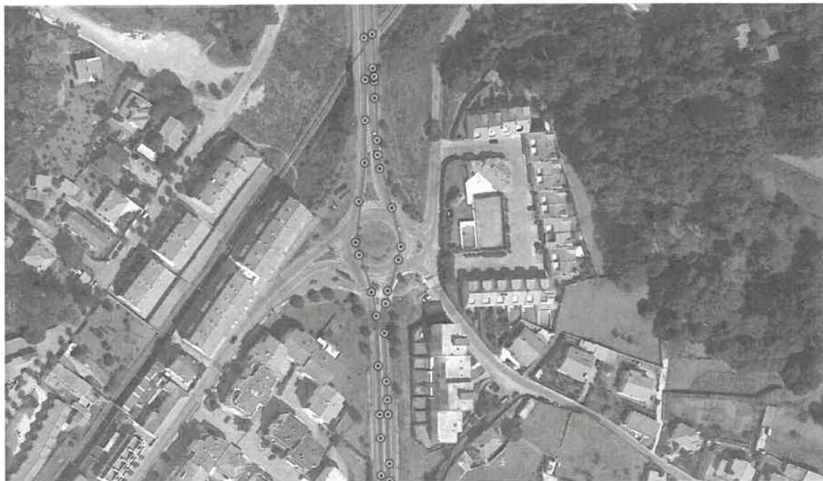
EN13 - Passagem na rotunda de Moledo