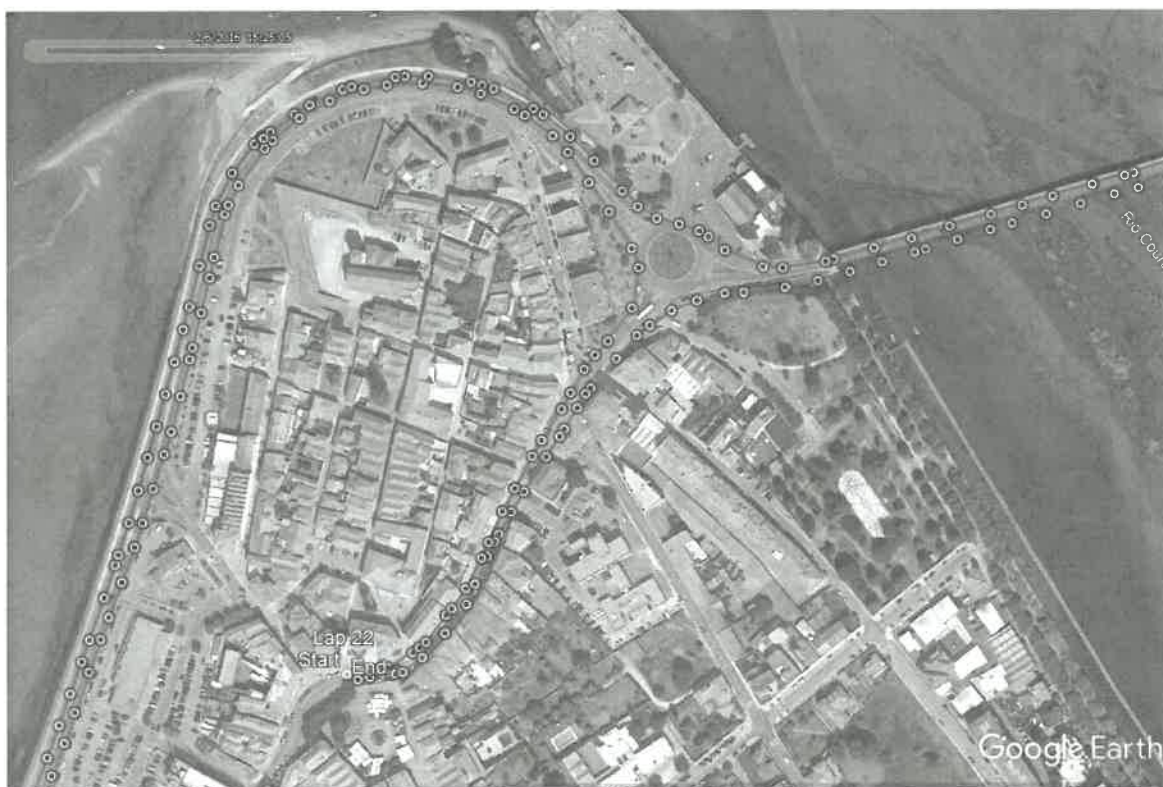
Partida e meta – Praça Conselheiro Silva Torres, Caminha e Vilarelho