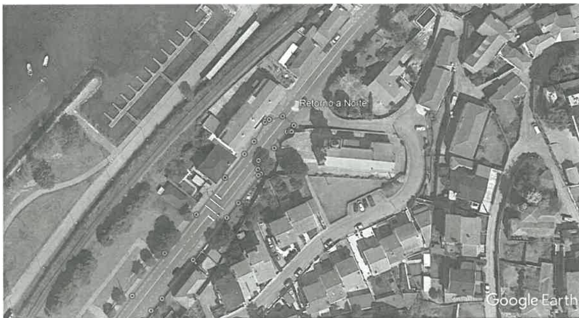
Ponto de Retorno a Norte – Entroncamento com a Rua Arq. Ventura Terra, Seixas